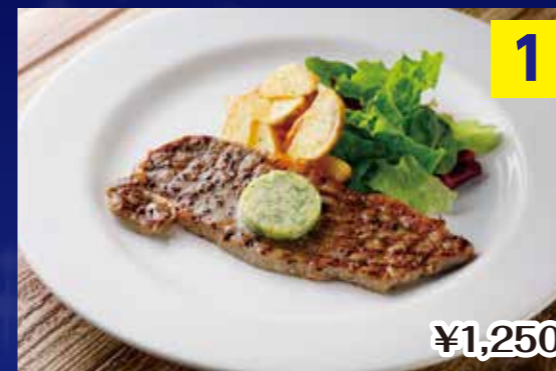
①ガーリックステーキ ハーブバターを添えて Garlic steak (Beef tallow infusion processed meat)