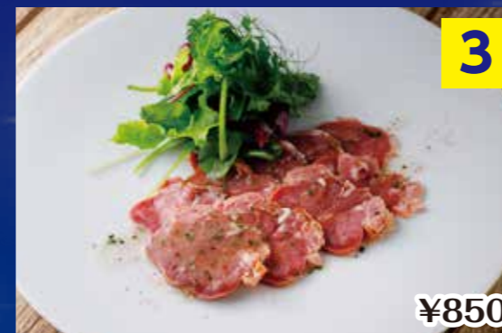
③スモークした豚タンのサラダ仕立て Smoked pork tongue salad style