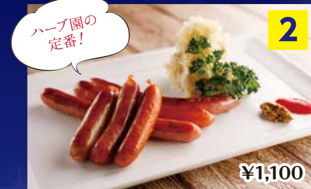
②ハーブ園オリジナル ハーブソーセージ盛り合わせ Sausage assortment