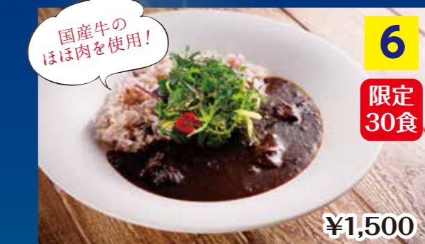
⑥神戸ブラックカレー(オリジナル) Kobe Black Curry (Herb Gardens Original)

スパイスの香ばしさと旨みが口に入れたとたんに広がる まろやかなブラックカレーです