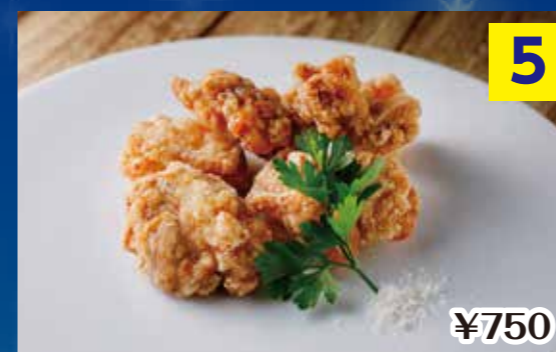
⑤トリュフ香るポッコフリット Fried chicken