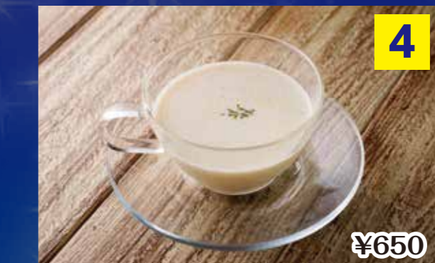
④甘酒とジャガイモのヴィシソワーズ Bisouise of "AMAZAKE" and potatoes