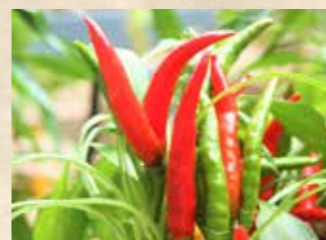
トウガラシ 上旬~中旬 家庭菜園ポタジェ