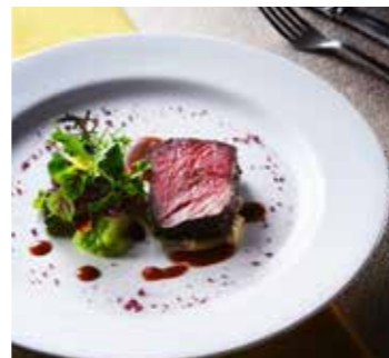
アンガス牛のグリル ホルチーニ賞のリゾットを添えて ※Special Menu プラス500円