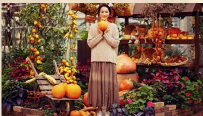
ハロウィンフェア