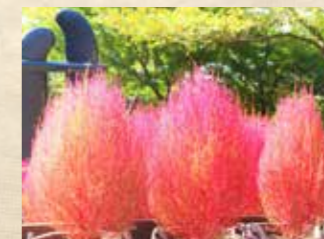
コキア 下旬~ 出合いの門