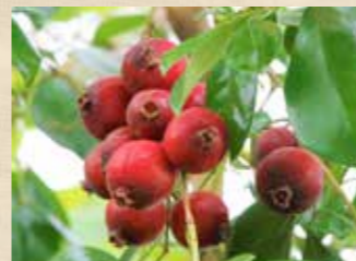
ストロベリーグアバ 中旬~ ガラスハウス(温室)