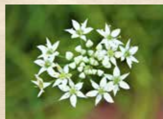
ガーリックチャイブ 上旬~下旬 ハーブミュージアム/出合いの門