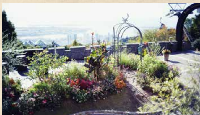
秋のウェルカムガーデン