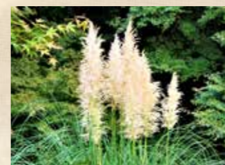
バンパスグラス 上旬~下旬 園内各所