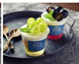
1階テラス 季節のスペシャルサヴァラン (巨峰、シャインマスカット)