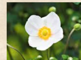
シュウメイギク 中旬~ 園内各所