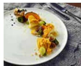
2階カフェラウンジ 季節のクリエイション