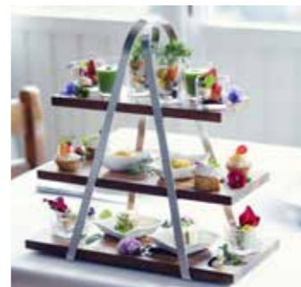
前菜スタンド ~ガーデンからのおもてなし~