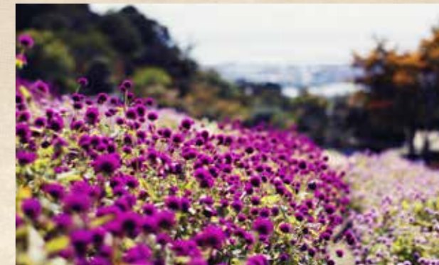
センニチコウ 上旬~ 風の丘フラワー園