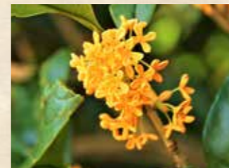
キンモクセイ 下旬~ 園内各所