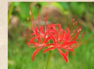
ヒガンバナ 下旬~ オリエンタルガーデン