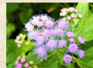
ユーパトリウム 上旬~ 四季の庭