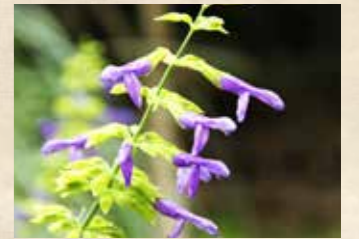
サルビア・ライムライト 上旬~下旬 四季の庭