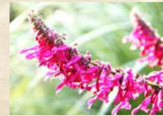
サルビア・イオダンタ 上旬~下旬 四季の庭