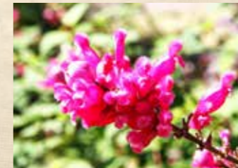
ローズリーフセージ 上旬~下旬 四季の庭