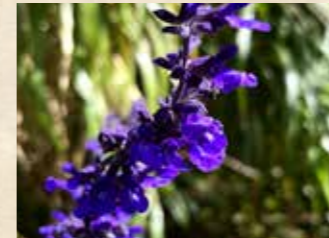
ラベンダーセージ 上旬~下旬 四季の庭