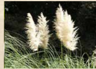
パンパスグラス 上旬~下旬 園内各所