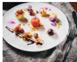
2階カフェラウンジ 季節のクレーション