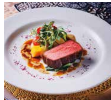
アンガス牛の「サブトロン」ロースト ポルチーニのクリームソース ※Special Menu プラス500円