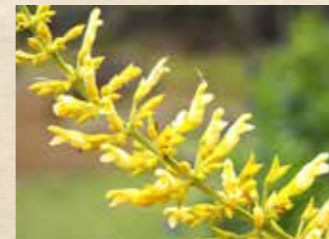
カリア・イェロージャスティ 上旬~下旬 四季の庭