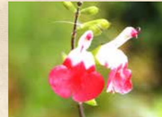
チェリーセージ 上旬~下旬 園内各所