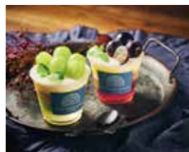
1階テラス 季節のスペシャルサヴァラン (シャインマスカット、巨峰)