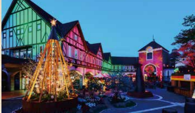
古城のクリスマス2023 - ボタニカルクリスマス - 11/11(土)~12/25(月)