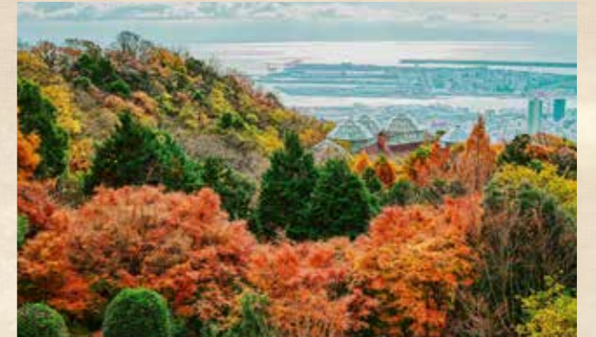
紅葉 上旬~ 園内各所