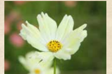
コスモス 上旬~ 風の丘フラワー園