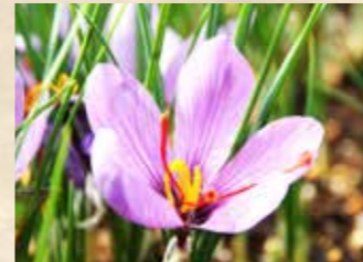
サフラン 上旬~中旬 ハーブミュージアム