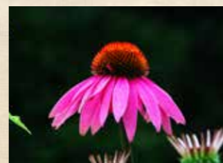
エキナセア 上旬~下旬 園内各所