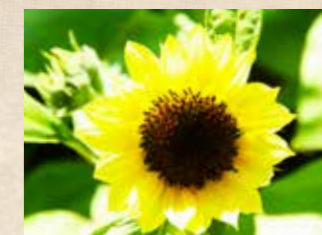
ヒマワリ 下旬~ 四季の庭