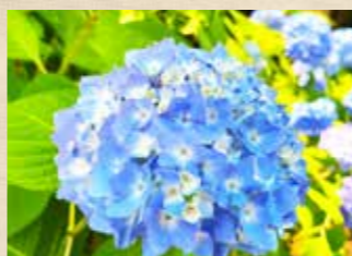
セイヨウアジサイ 上旬~下旬 林の小径