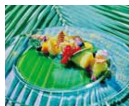
2階カフェラウンジ 季節のクリエイション