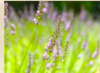
ラバンディンラベンダー 上旬 ラベンダー園