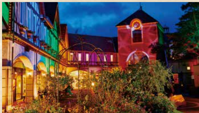
光の森 ~Forest of Illuminations~ 「森の大聖堂」