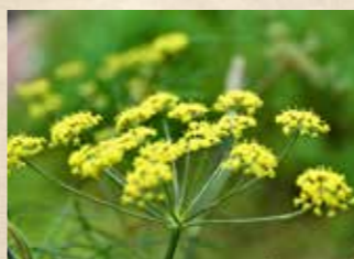
フェンネル 上旬~中旬 ハーブミュージアム/ガラスハウス前