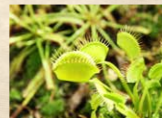
食虫植物 中旬~ ガラスハウス(エントランス)