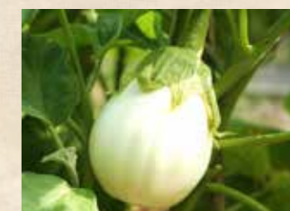
夏野菜 上旬~下旬 家庭菜園ポタジェ