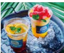
1階テラス マンゴー&ハイビスカスフラッパ オレンジとレモンのティーソーダ