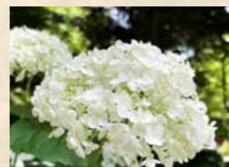
アジサイ'アナベル' 上旬~下旬 四季の庭