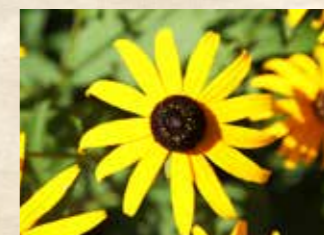
ルドベキア 上旬~下旬 園内各所