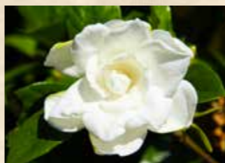
クチナシ 上旬 園内各所