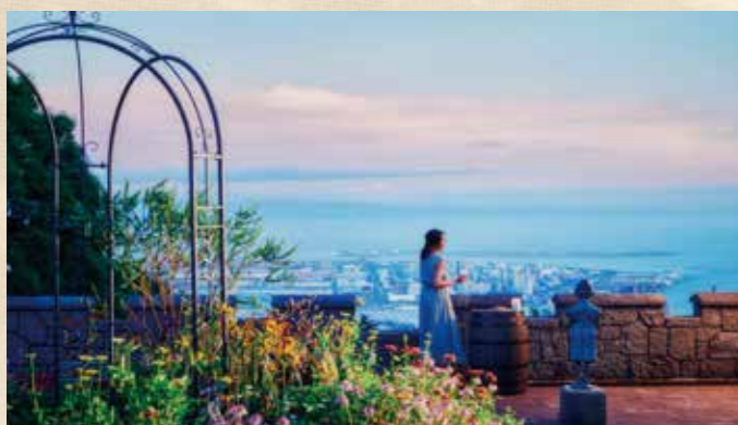
神戸ガーデンテラスバー