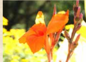
カンナ 上旬~下旬 園内各所