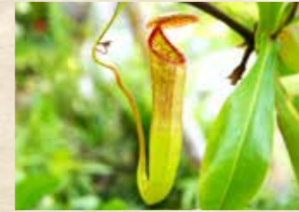
食虫植物 上旬~下旬 ガラスハウス(エントランス/温室)