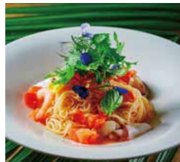
完熟トマトと魚介の冷たいパスタ ※ Special Menu プラス 500円