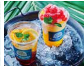
1階テラス マンゴー&ハイビスカスフラッパ オレンジとレモンのティーソーダ