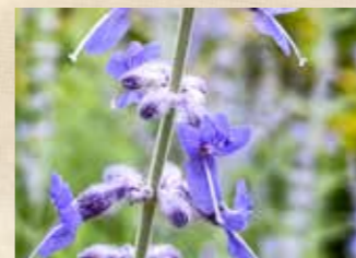
ロシアンセージ 上旬~下旬 園内各所