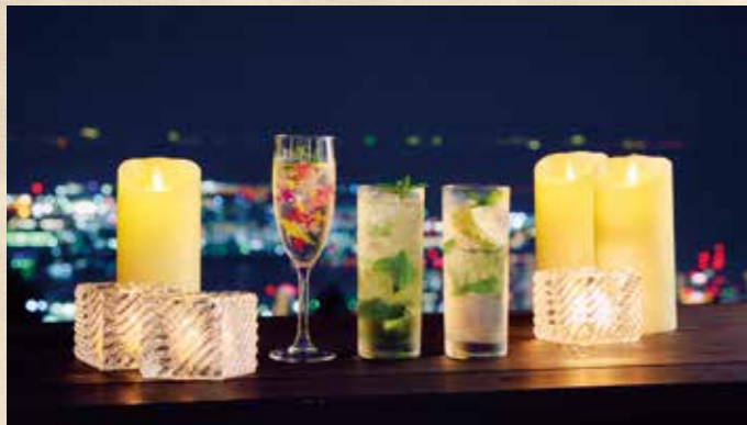
神戸ガーデンテラスパー