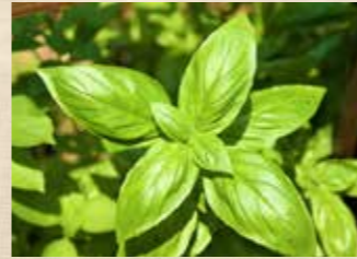
バジル 上旬~下旬 ハーブミュージアム