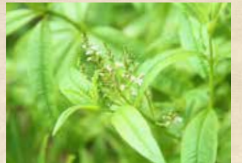
レモンバーベナ 上旬~ ハーブミュージアム/四季の庭