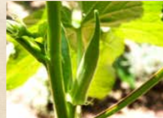
夏野菜 上旬~下旬 家庭菜園ポタジェ