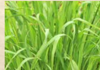
レモングラス 上旬~ ハーブミュージアム/四季の庭