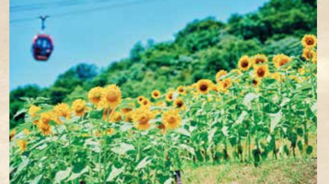
ヒマワリ 上旬~下旬 園内各所