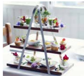
前菜スタンド ~ガーデンからのおもてなし~