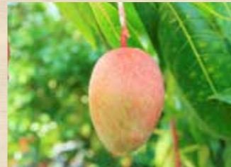
マンゴー 上旬~下旬 ガラスハウス(温室)