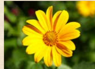
ヒメヒマワリ 上旬~下旬 四季の庭