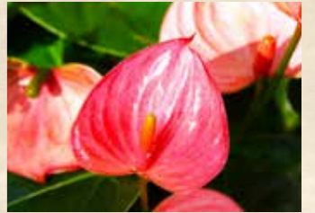
アンスリウム 上旬~下旬 ガラスハウス(エントランス/温室)