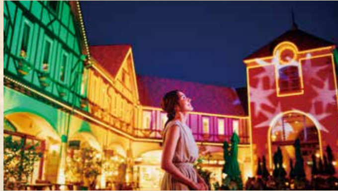
光の森 ~Forest of Illuminations~ 「森の大聖堂」

GARDEN FEST 2024 -Summer- 9/1まで 毎日ナイター営業を開催