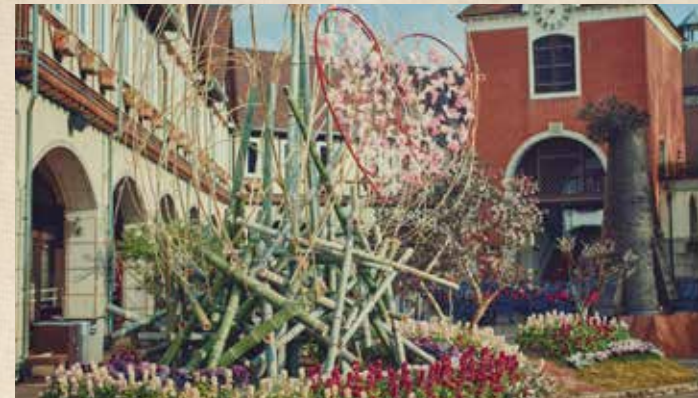
ウェルカムガーデン ※2025年1月の写真です