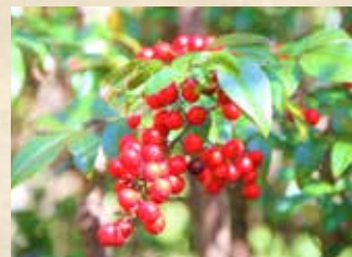
ナンテン 上旬～下旬 園内各所