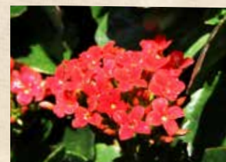
カランコエ 上旬～ グラスハウス(温室)