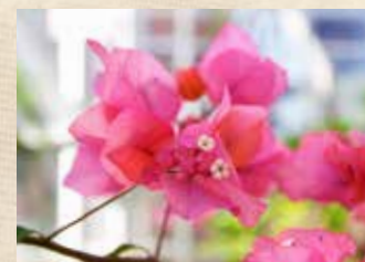
ブーゲンビレア 上旬～ グラスハウス(温室)