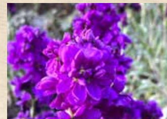
ストック 上旬～ 園内各所