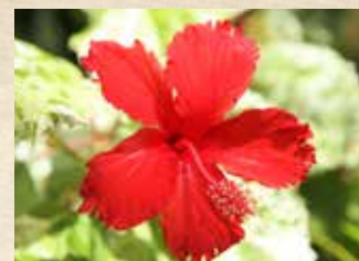
ハイビスカス 上旬～ グラスハウス(温室)