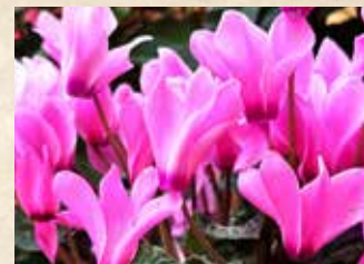
シクラメン 上旬～下旬 グラスハウス(温室)