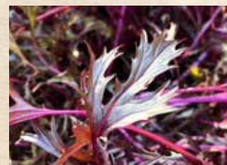
冬野菜 上旬～ 家庭菜園ポタジェ