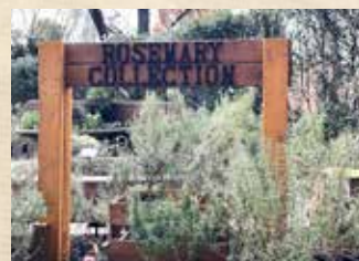
ローズマリーコレクション 上旬～ ハーブミュージアム