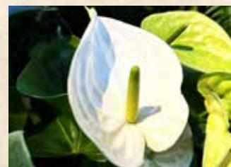
アンズリウム 上旬～ グラスハウス(温室)