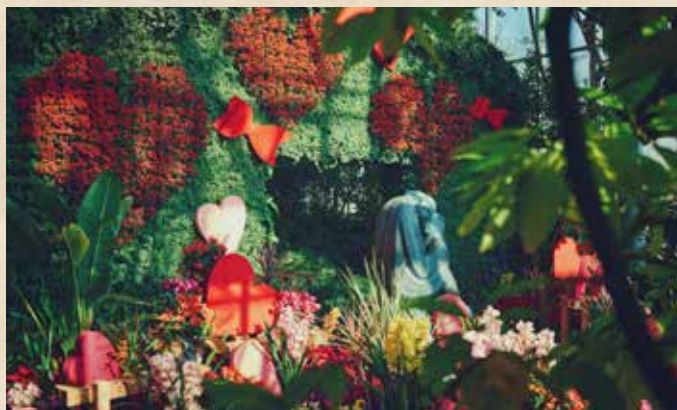
ウィンターガーデンフェア 1/5(月)～1/23(金) 「愛の像」