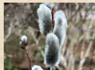
ネコヤナギ 中旬～ オリエンタルガーデン