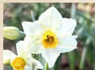
スイセン 中旬～ 園内各所