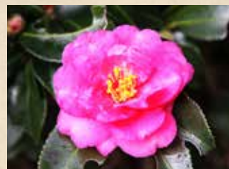
カンツバキ 上旬～下旬 園内各所