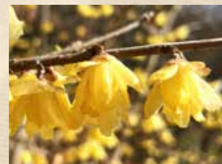
ソシンロウバイ 上旬～下旬 園内各所