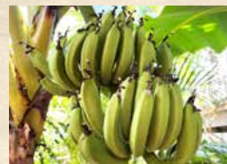
バナナ 上旬～ グラスハウス(温室)