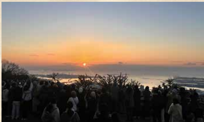
初日の出 元旦早朝営業 6:00～