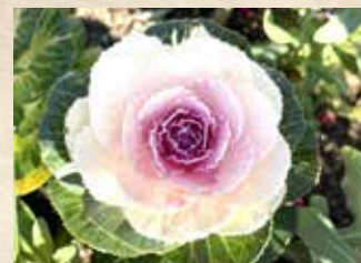
ハボタン 上旬～下旬 展望プラザ