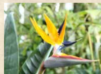
ストレリチア 中旬～ グラスハウス(温室)