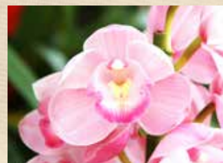
シンビジウム 上旬～ グラスハウス(温室)